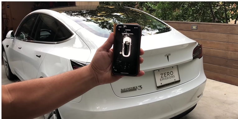
Tesla dengan teknologi panggilan jarak jauh